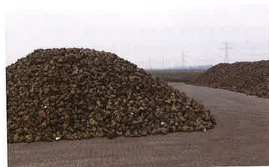
Omvangrijke oogst verwacht

kwaliteitsverlies en de kosten voor vorstvrije bewaring, is de premie ook een extra waardering voor de langdurigere bewaring en het risico dat daarmee samenhangt.